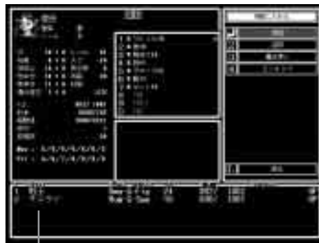
パーティウインドウ

パーティに仲間を加えます。キャラクターを選ぶと画面下部のパーティウインドウに選んだキャラクターが移動します。注意点としては、酒場では性格の合わ